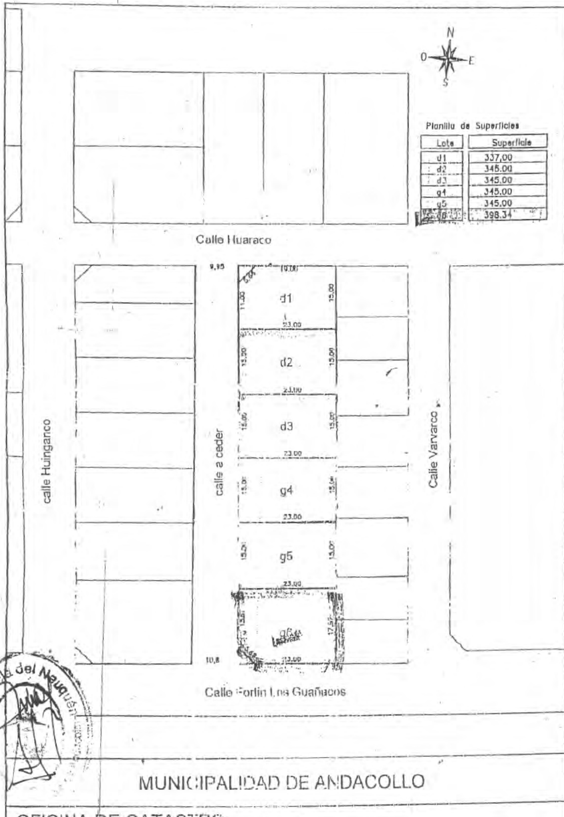
Planilla de Superficies