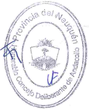
Lámina 2 - Son 3 Láminas Expte. n° E 2756-7906/03