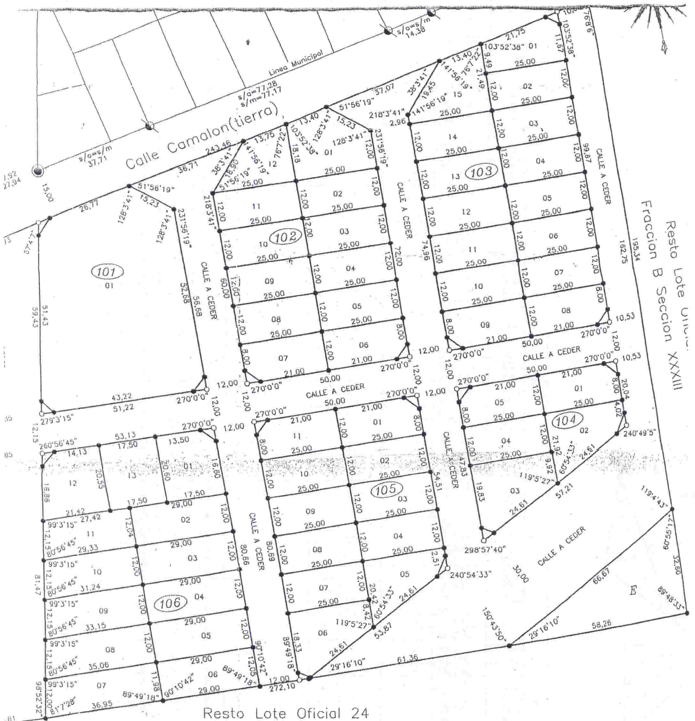
Resto Lote Oficial 24 Fraccion B Seccion XXXIII